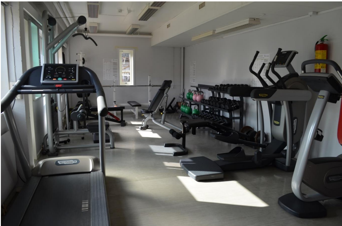
Treningsrom og nedenfor biljardbord