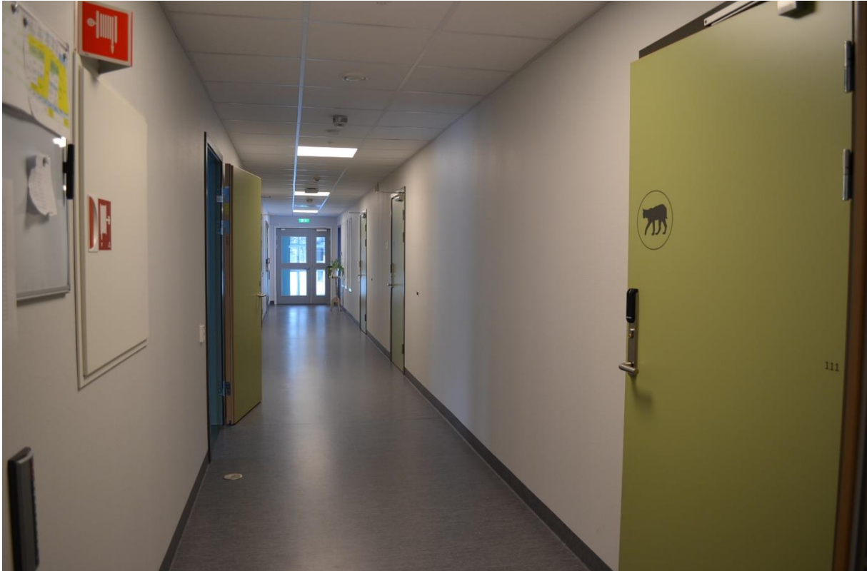
Korridor til pasientrommene