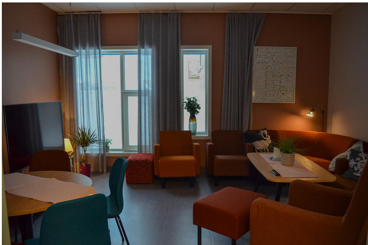
En av stuene