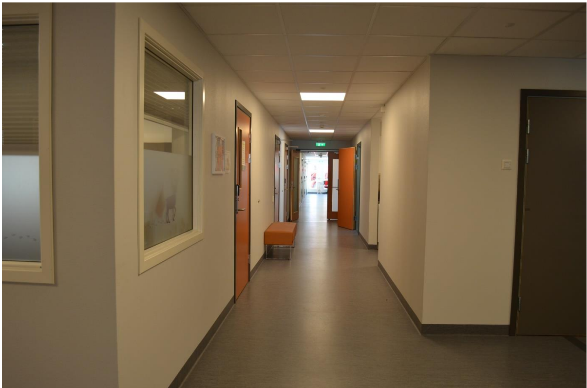
Korridor med dører til vaktrommet og videre til pasientrommene