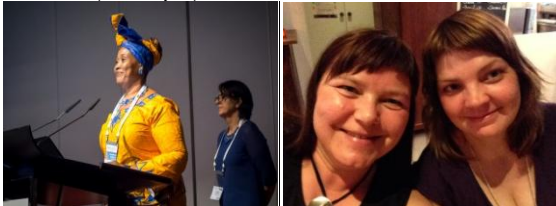
Foredragsholder fra USA